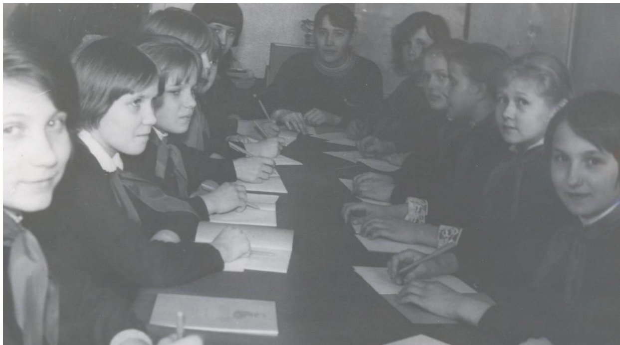
Заседание совета дружины.