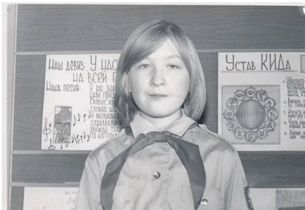
Член школьного клуба интернациональной дружбы.