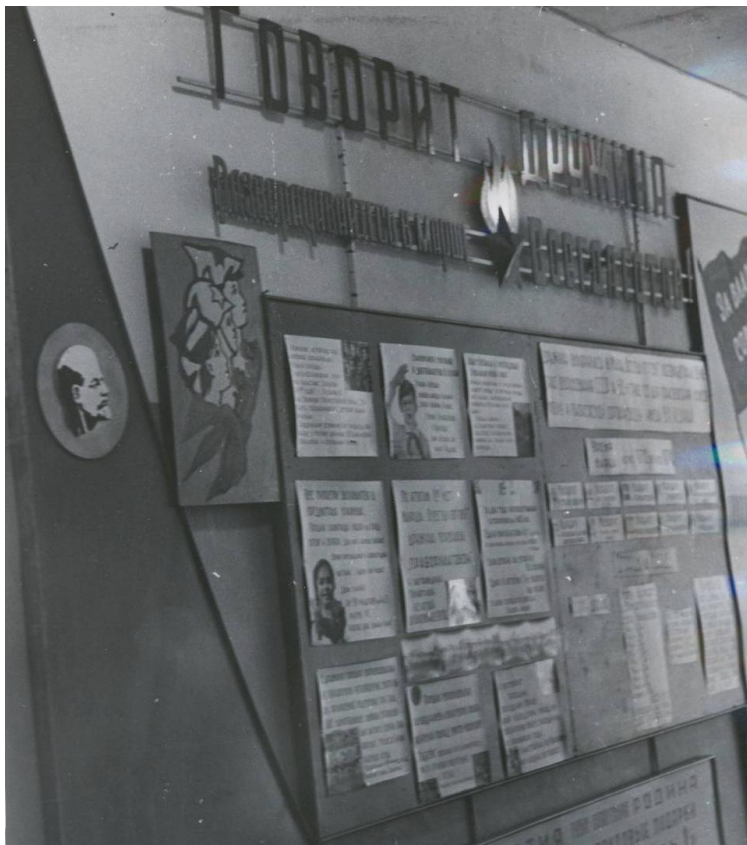
Общешкольный стенд пионерской дружины школы.

Лето 1985 года - пионеры Вологодчины подготовили 600 сувениров участникам XII Всемирного фестиваля молодежи и студентов в Москве. 300 лучших подарков направлены в Москву.