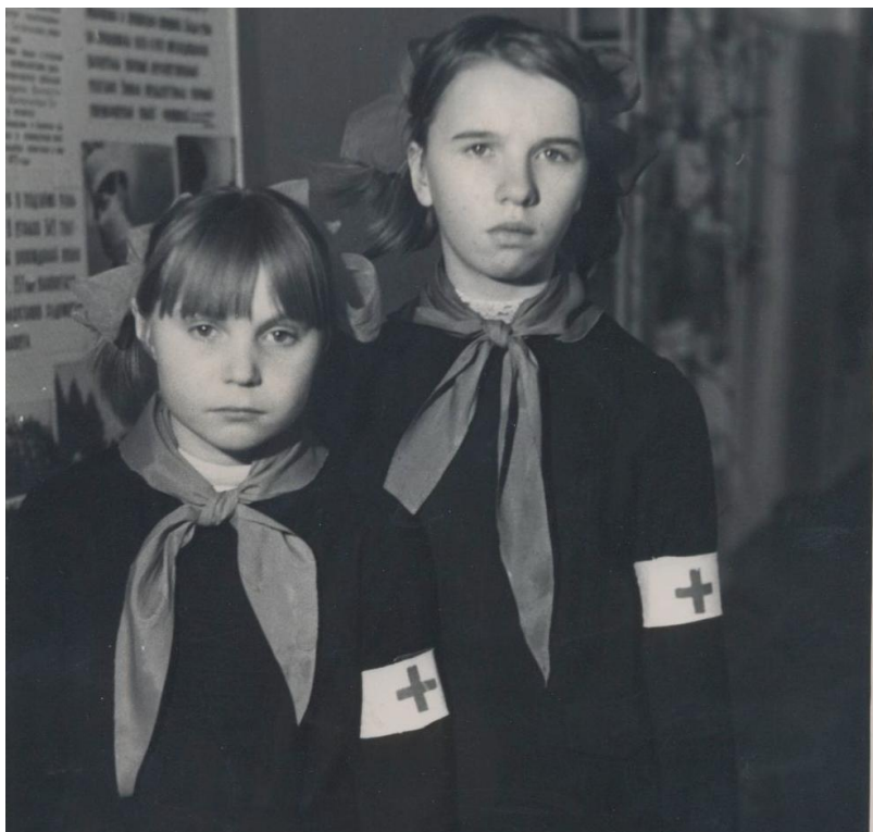
Ответственные за санитарное состояние школы.