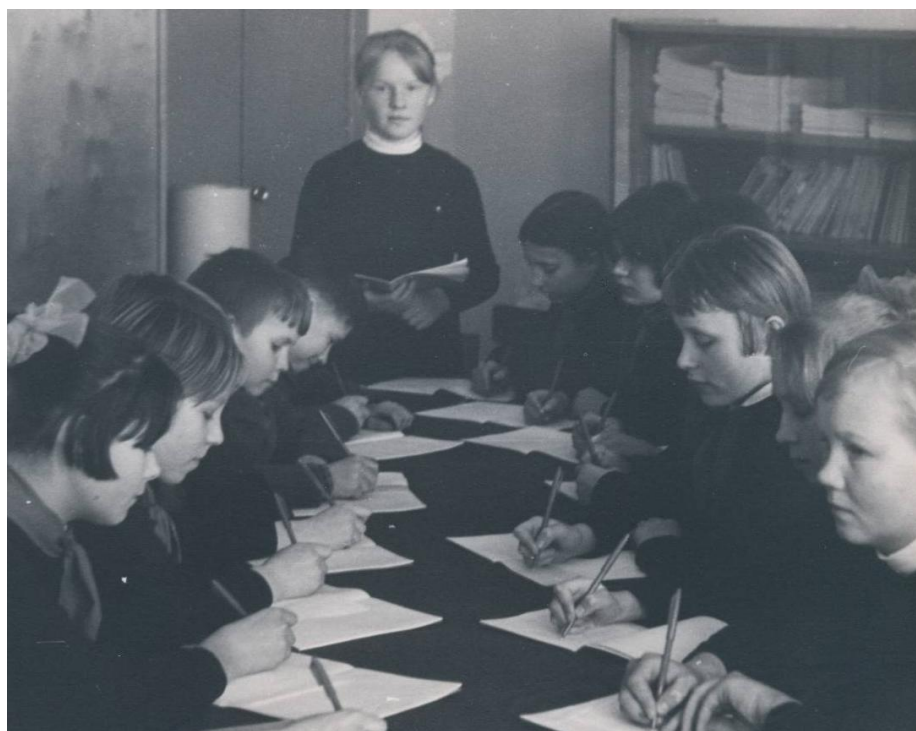
Заседание школьного комитета комсомола.