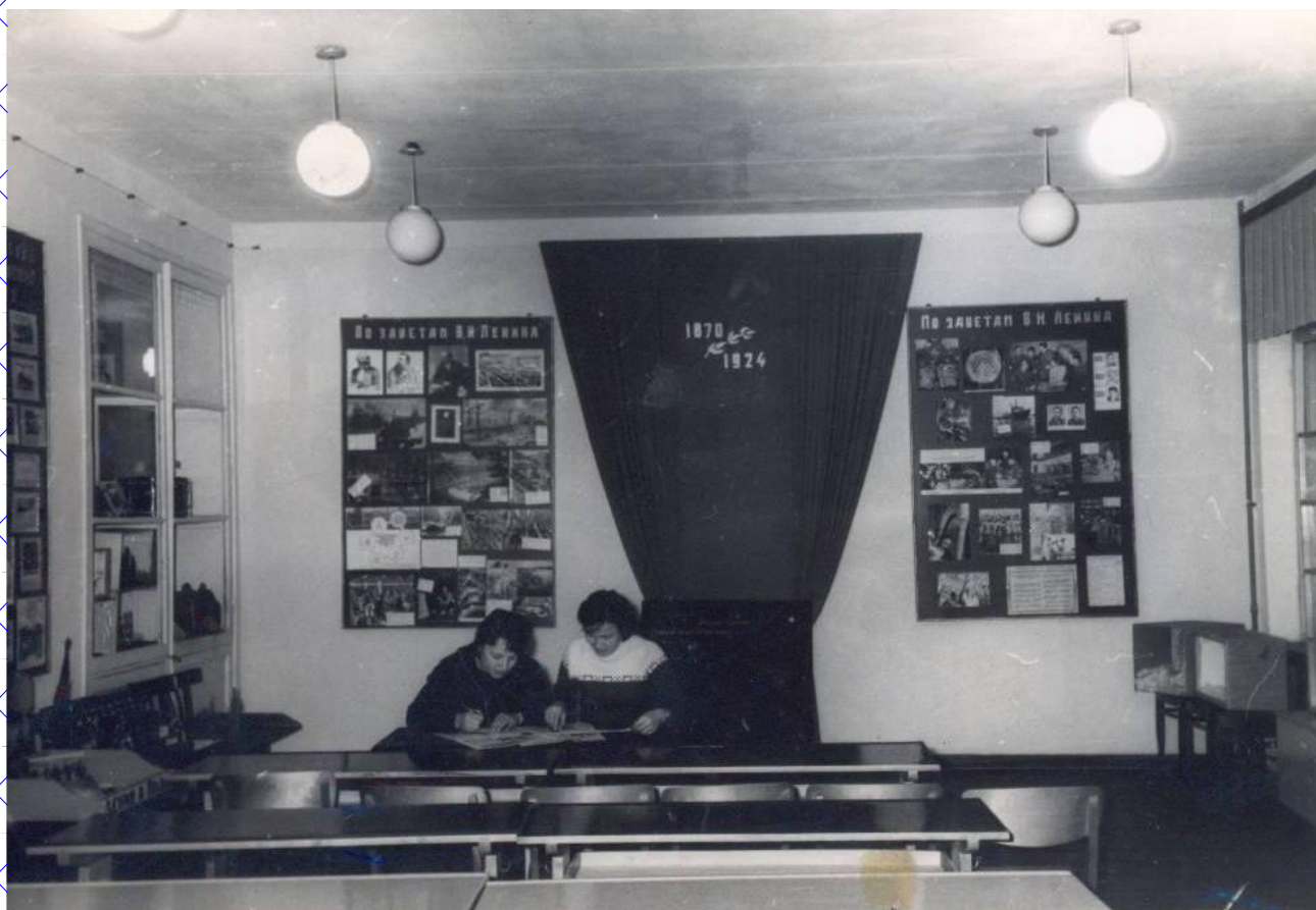
В Ленинском зале.

Дружина признана одной из лучших в области в экспедиции «Заветам Ленина верны» и награждена Красным Знаменем, которое вручено дружине на вечное хранение.