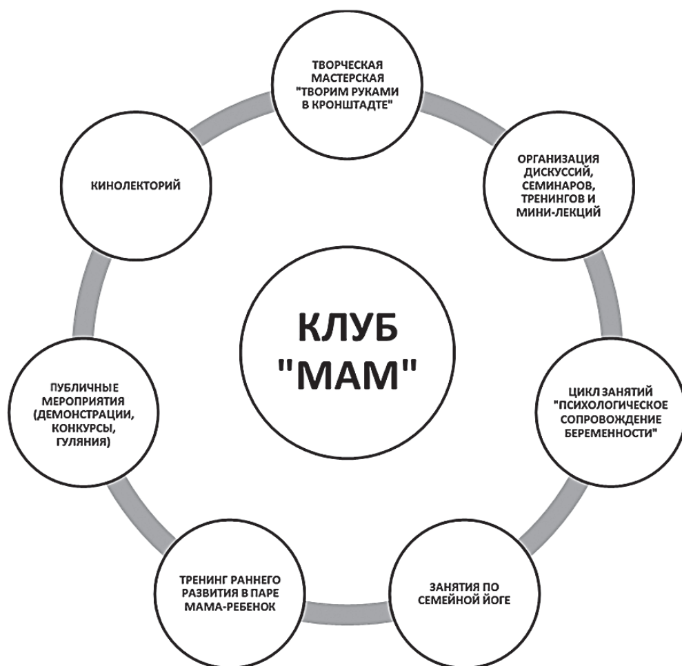
Рис. 1. Схема работы Клуба «МАМ»

Специалисты, работающие в Клубе, принимают детей и взрослых такими, каковы они есть, опираясь на положительные свойства их характера, для последующего формирования других, более значимых качеств личности.